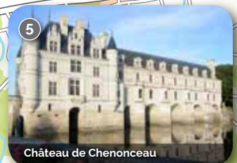
Château de Chenonceau