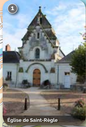
Église de Saint-Règle