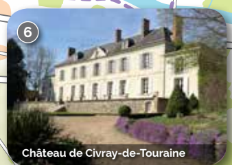
Château de Civray-de-Touraine