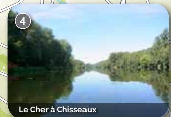
Le Cher à Chisseaux