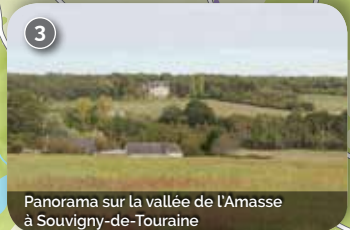
Panorama sur la vallée de l'Amasse à Souvigny-de-Touraine