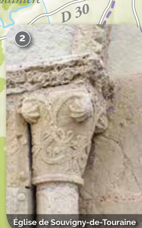
Église de Souvigny-de-Touraine