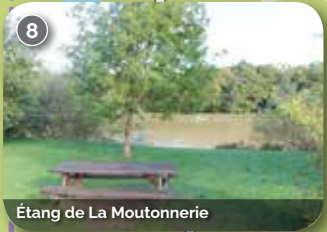
Étang de La Moutonnerie