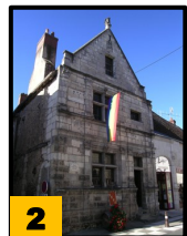
2 Manoir Thomas- Bohier