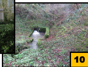
Château du Boulay