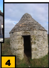
Loges de vigne